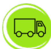
Zeleris Europa Terrestre