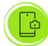
Servicio entrega con foto o PIN