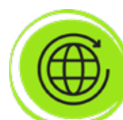
Zeleris B2C Europa