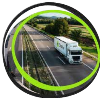
Transporte nacional e internacional