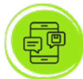
Servicio preaviso concertación cita