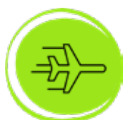
Zeleris Global Aéreo